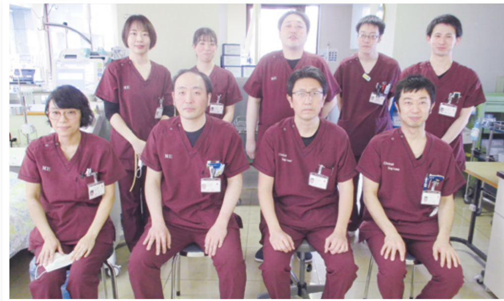
血液浄化療法課スタッフの皆さん

当院における臨床工学技士(CE: Clinical Engineers)の業務には医療機器管理業務、手術室業務、集中治療室業務、心臓カテーテル業務、高気圧酸素治療業務など様々なものがあります。今回は、その中の一つである血液浄化療法業務についてご紹介します。 血液浄化療法は、患者さんの血液を体外に取り出して、その中から疾患の原因となる有毒な物質を取り除く治療法です。最も広く行われている血液浄化療法は、慢性腎不全の患者さんに対する透析療法です。 我々臨床工学技士は、透析装置の準備や操作、保守点検などを行い安全に治療ができるよう管理しています。また、患者さんの状態に応じて医師や看護師と連携して適した器材の選択や透析治療条件などを提供しています。 透析療法以外には、集中治療室において低下した腎臓の機能を代替する持続的腎代替療法、免疫疾患