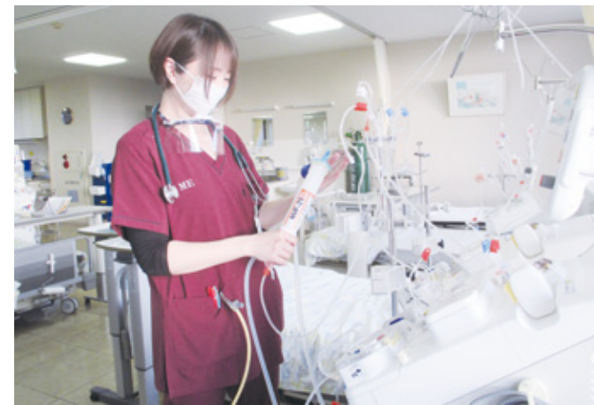
透析回路の組み立て

当院における臨床工学技士(CE: Clinical Engineers)の業務には医療機器管理業務、手術室業務、集中治療室業務、心臓カテーテル業務、高気圧酸素治療業務など様々なものがあります。今回は、その中の一つである血液浄化療法業務についてご紹介します。 血液浄化療法は、患者さんの血液を体外に取り出して、その中から疾患の原因となる有毒な物質を取り除く治療法です。最も広く行われている血液浄化療法は、慢性腎不全の患者さんに対する透析療法です。 我々臨床工学技士は、透析装置の準備や操作、保守点検などを行い安全に治療ができるよう管理しています。また、患者さんの状態に応じて医師や看護師と連携して適した器材の選択や透析治療条件などを提供しています。 透析療法以外には、集中治療室において低下した腎臓の機能を代替する持続的腎代替療法、免疫疾患