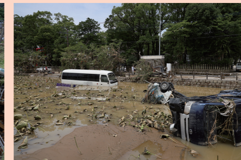
水が引き、押し流された車が残された