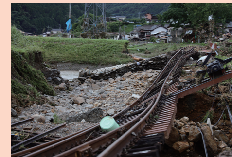
鋼鉄の線路も土台から押し曲げられた

氾濫した球磨川の濁流にのみ込まれた人吉市の繁華街では、街灯の上にまで濁流の残骸が絡み付いていた