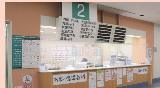
窓口各所にビニールカーテン