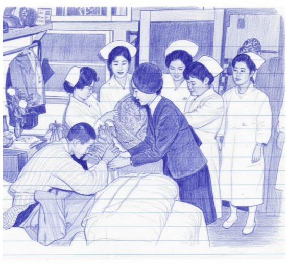
昭和の頃の贈呈式