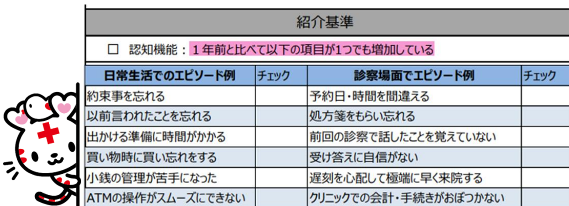
図1 MCI・軽度認知症 精査依頼状の最新様式

「どの時点で紹介してよいのか迷う」というお声をいただくことがありますが、治療対象となるかどうかの評価、必要な検査、治療内容やリスクの説明は、当院神経内科で一括して実施しております。そのため、ご判断に迷われる段階でも構いませんので、お気軽にご紹介ください。